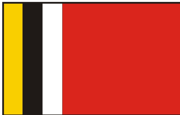
Flaga Gminy Radziejów