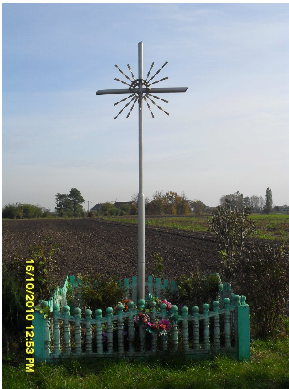
Przydrożny krzyż na rozwidleniu dróg biegnących z Bieganowa do Szczebłotowa