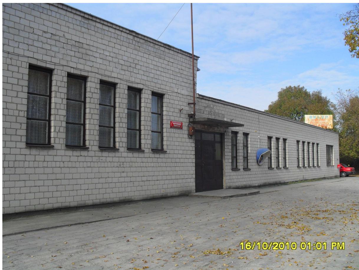
Świetlica w Bieganowie