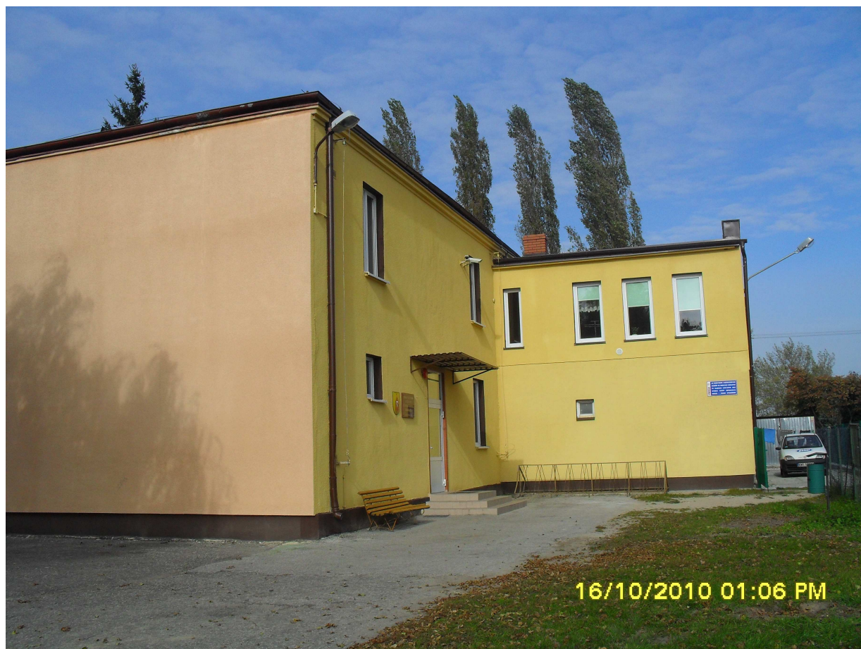
Szkoła Podstawowa w Bieganowie im. Stefana Kardynała Wyszyńskiego