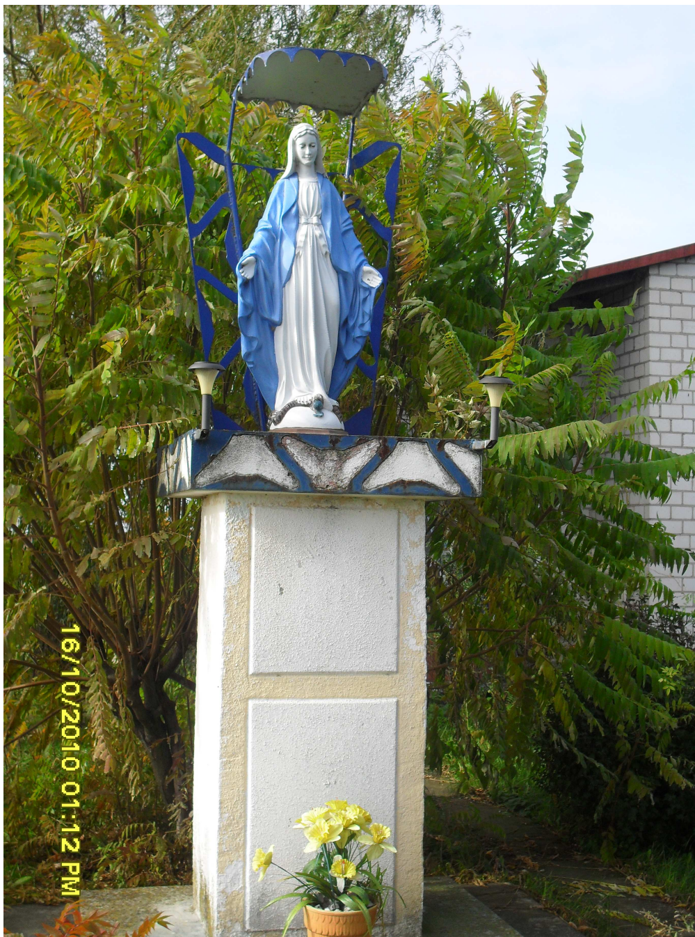
Figura Matki Boskiej z 1995 roku