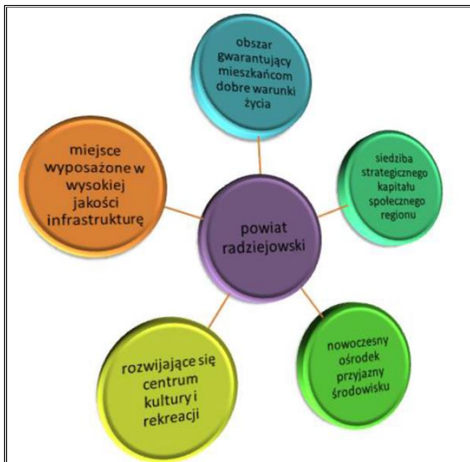
Rysunek 2. Wizja rozwoju Powiatu Radziejowskiego